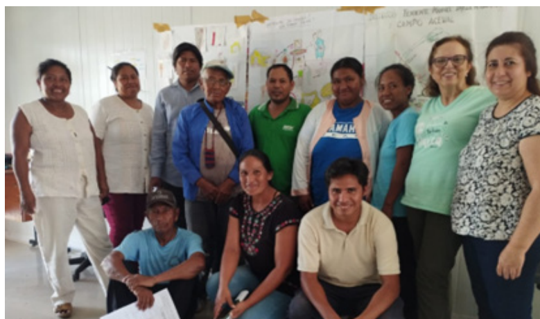
Reunión con representantes del MSPBS, Consejo Local de Salud y líderes Indígenas en la Unidad de Salud Familiar El Estriba en Teniente Irala Fernández.