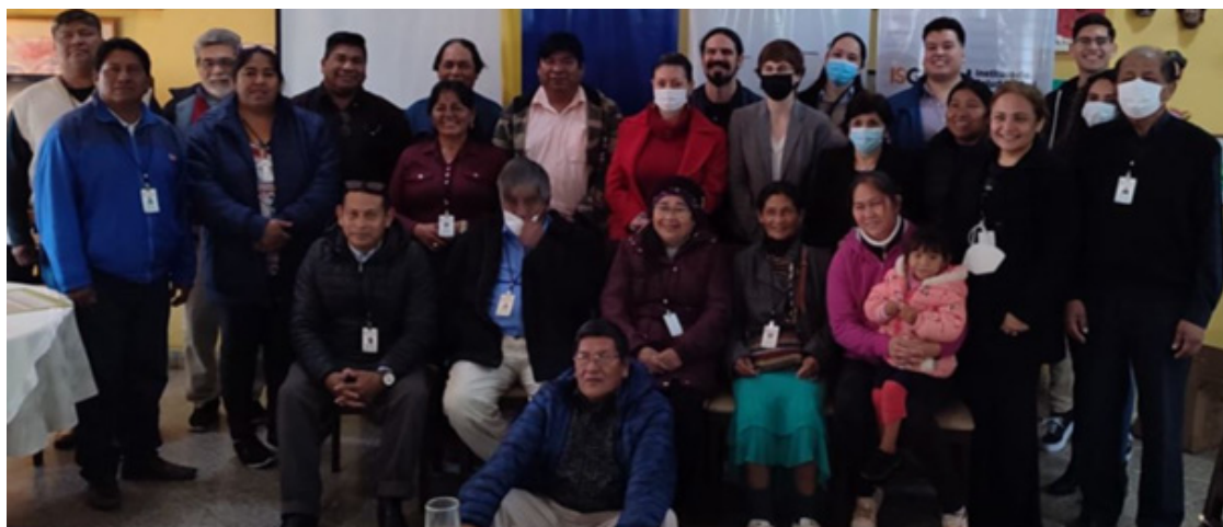
Reunión con el CONASAPI y la DINASAPI.