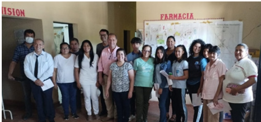
Reunión en la Unidad de Salud Familiar de Campo Aceval, con representantes del Consejo Local de Salud, Municipalidad, Junta Municipal, MSPBS, docentes y alumnos.