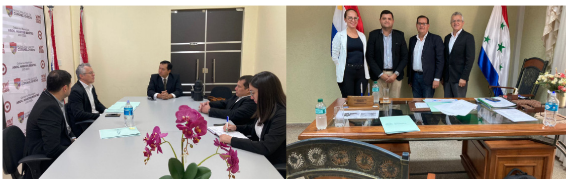
Socialización de la Encuesta sobre Calidad de los Registros Administrativos en el departamento de Caaguazú.