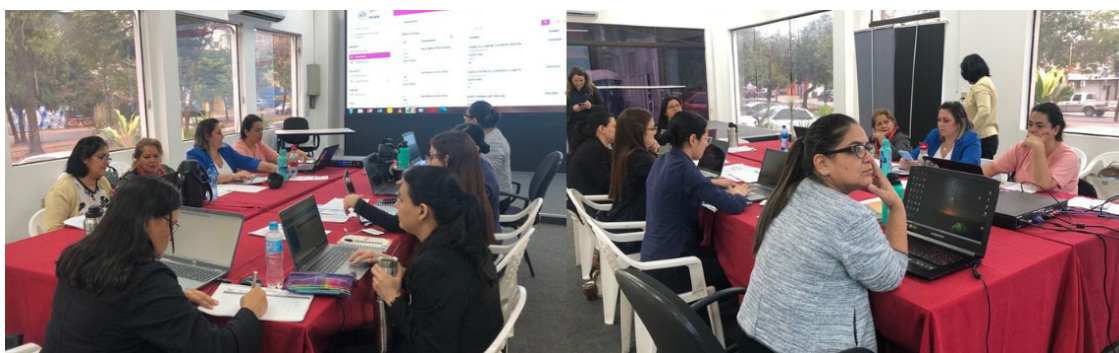
El INE y MINMUJER trabajan en conjunto para el fortalecimiento estadístico del SISEN.

https://www.ine.gov.py/noticias/1657/el-ine-y-min-mujer-trabajan-en-conjunto-para-el-fortalecimiento-estadistico-del-sisen