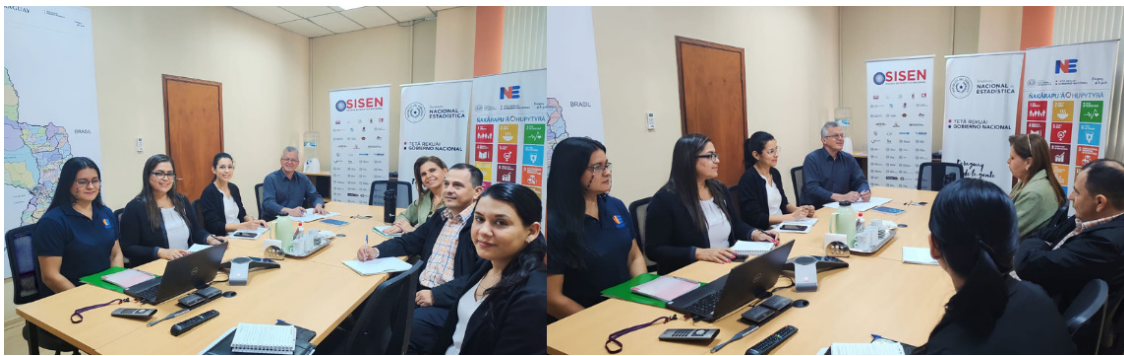
El INE apoya a ERSSAN en el proceso de fortalecimiento estadístico.

https://www.ine.gov.py/noticias/1574/el-ine-apo-ya-a-erssan-en-el-proceso-de-fortalecimiento-estadistico